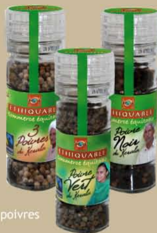
3 saveurs : vert, noir & mélange 3 poivres

La gamme poivre du Kerala se décline en trois saveurs : noir, vert et mélange 3 poivres (noir, vert et blanc). Ces moulins avec 2 possibilités de moutures révèlent toute la subtilité de ces poivres de pure origine, comme la saveur légèrement résineuse du poivre vert.