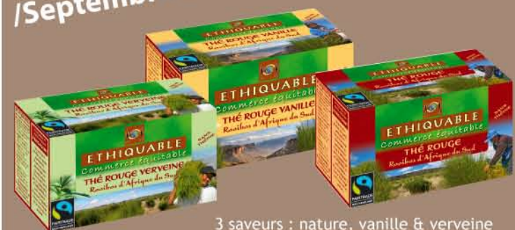
3 saveurs : nature, vanille & verveine