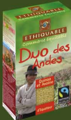
Cuisson 15 min.

La gamme Quinoa Ethiquable s'enrichit avec le Duo Quinoa/Avoine. Le quinoa est riche en protéine et en acides gras essentiels, c'est une des plantes les plus nutritives au monde. Il s'associe à l'avoine, qui est une excellente source de vitalité. Pour les producteurs de la coopérative Coprobich, ce duo permet de diversifier leur source de revenu, de limiter l'exode rural et de faire vivre leur culture traditionnelle. Entièrement fabriqué sur place, ce produit signifie aussi plus de valeur ajoutée pour les producteurs.