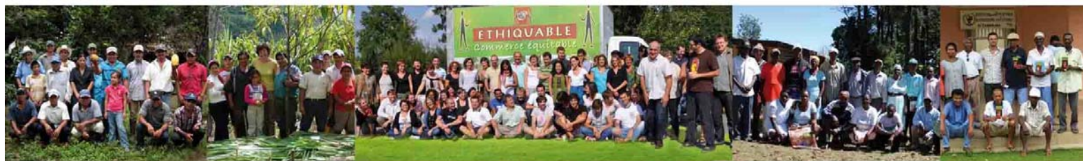
Coopérative CACAO NICA au Nicaragua